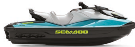
GTI™ SE 170