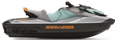
GTI™ SE 170