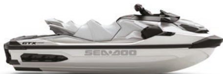
○ NYHET – White Pearl Premium