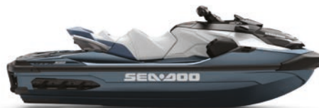
● Blue Abyss